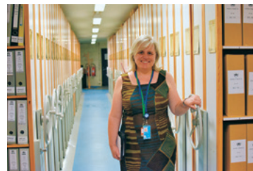
(写真はモンセラート、朝日新聞グループ、高橋友佳理氏撮影)

2015年と2016年は Fonds15/1「セルジオ・ビエラ・デメロ文書」の整理を行った。資料は書架延長16メートルと分量は多くない。