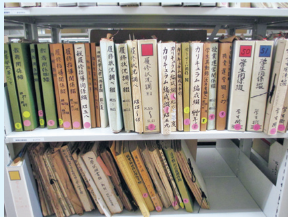
移送された教養部資料の一部

廃止されてすでに 20 年以上経ち、その存在も大学関係者の記憶から薄れつつある教養部ですが、戦後大学の新しい理念のもとで果たした役割について歴史的に検証する時期にあるように思われます。大学文書館では、本年度中に公開するべく整理を行っていきます。また、本年 7 月より開催予定の企画展でも教養部の歴史を取り上げます。