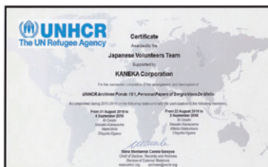
写真上：2014年、Fonds24 整理終了証 写真下：2016年、Fonds15/1 整理終了証