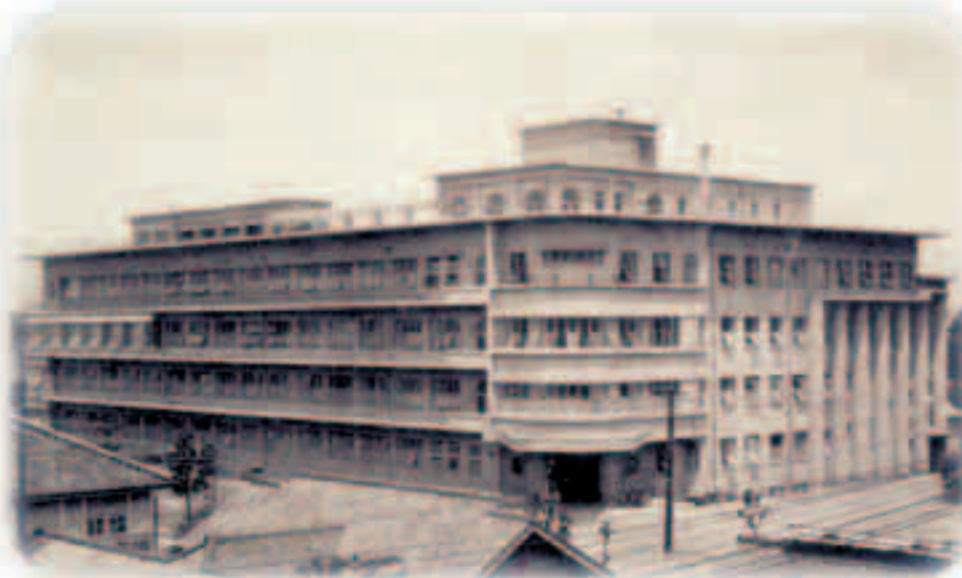
医学部附属病院婦人科学産科学教室