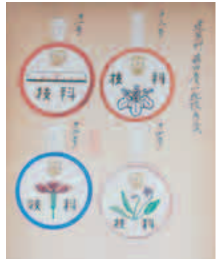
昭和20年8月4日起案「胸徽章決定二関スル件伺」 『文部省科学研究補助技術員京都養成所関係書類 第二号』

敗戦直前に、「精神一本主義よりも科学」という認識を持ち、帝大の教員の指導のもと、科学技術を学んだ女性たちがいたことはあまり知られていない。