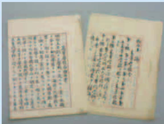
高等学校令関係資料

(閲覧にあたっては、資料の保護のためマイクロフィルムの紙焼き(コピー)でおねがいしています)